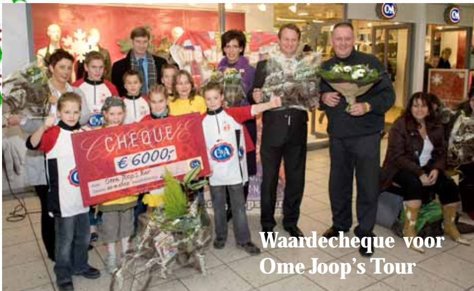
Waardecheque voor Ome Joop's Tour