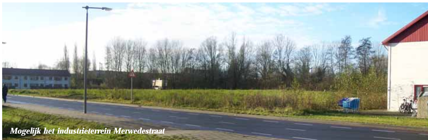
Mogelijk het industrieterrein Merwedestraat

De Werkgroep Woonomgeving Presikhaaf 1 maakt zich dan ook hard om die afspraak nu eindelijk uitgevoerd te krijgen. Daarnaast is bewegwijzering op de IJssellaan noodzakelijk om de verkeersstroom naar de moskee via de Eemslaan te leiden, waar gezorgd moet worden voor voldoende parkeermogelijkheden. Nu is ook het moment gekomen om het toegezegde groenplan -als compensatie van alle bomen die drie jaar geleden gekapt werden- op te stellen en tot uitvoer te brengen.