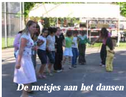
De meisjes aan het dansen

smakelijk feest van te maken. De sport- en spelmiddagen gaan tot de zomer in ieder geval door: op woensdag en vrijdag van 16.00 tot 17.00 uur.