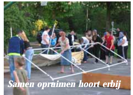
Samen opruimen hoort erbij

De resultaten van 50 huisgesprekken in de Roompotstraat, Slaakweg, Laan van Presikhaaf en Spuistraat zijn in een kort verslag weergegeven. Vervuiling van de gemeenschappelijke ruimten en bepaald gedrag blijken de grootste problemen. De wil om het met elkaar anders te doen is bij een aantal mensen aanwezig. Alle bewoners van deze buurt krijgen