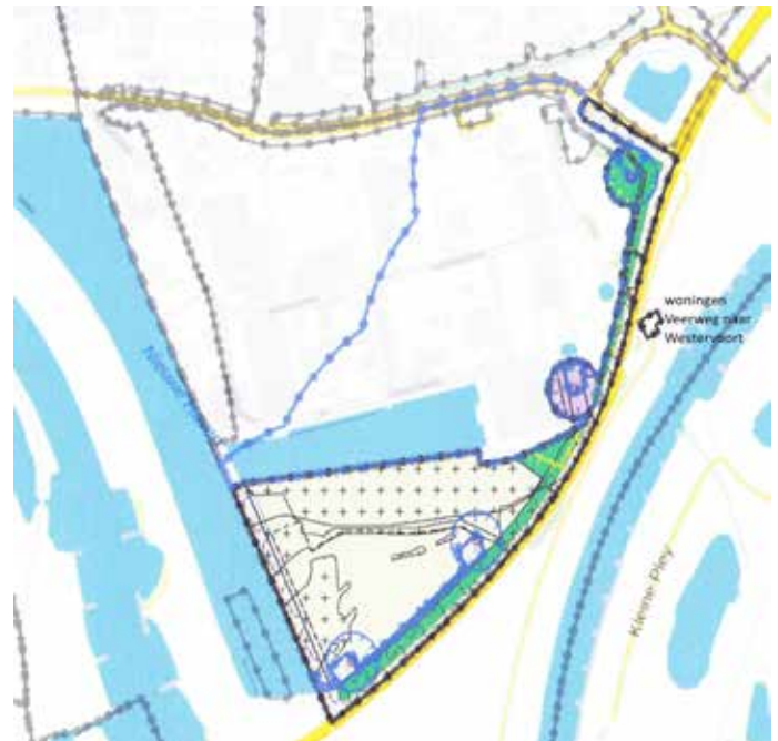
Foto: Bestemmingsplankaart Windpark en zonneveld Koningspleij Noord. Rechts van de bestemmingsplangrens de twee woningen aan de Veerweg naar Westervoort.

De Raad van State ging niet akkoord met het standpunt van de gemeenteraad de woningen als bedrijfswoningen te bestempe-