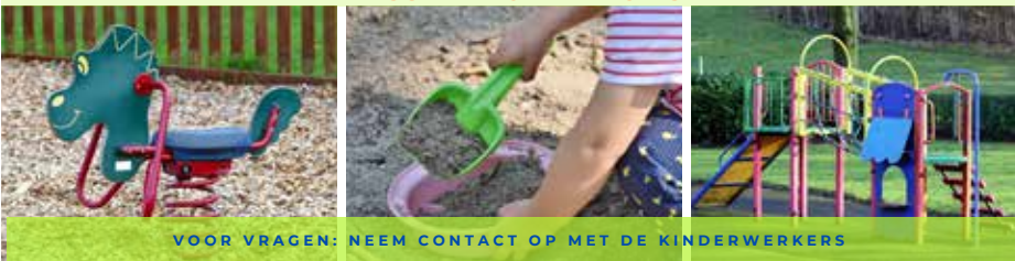
VOOR VRAGEN: NEEM CONTACT OP MET DE KINDERWERKERS

AFSPRAKEN: MAXIMAAL 3 BEGELEIDERS, WE HOUDEN 1,5 METER AFSTAND, GEEN OUDERS DIE BLIJVEN HANGEN EN HANDEN WASSEN BIJ AANKOMST